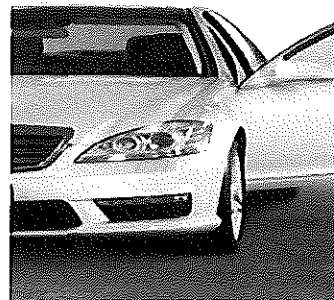
Producto 143542 ER 91

Oferta válida hasta el 31 de agosto de 2016. Préstamo Auto: Financiación para coche nuevo o con antigüedad inferior a 12 meses. 1) Tipo de interés nominal anual (cumpliendo condiciones): 5,95%. 6,77% TAE calculada para un préstamo de 10.000 € a un plazo de 5 años y comisión de apertura de 1,5% (financiada); el importe total adeudado (incluye importe solicitado, comisiones e intereses) es de 11.759,52 €; cuota mensual: 195,99 €. 6,54% TAE calculada para un préstamo de 30.000 € a un plazo de 8 años y comisión de apertura del 1,5% (financiada); el importe total adeudado (incluye importe solicitado, comisiones e intereses) es de 38.343,90 €; cuota mensual: 399,42 €. 2) En caso de no cumplir condiciones: tipo de interés nominal anual: 8,95% (10,02% TAE), según se cumplen condiciones se va reduciendo el tipo de interés nominal anual aplicable: domiciliación de nómina o Seguros Sociales (-2%); domiciliación de 3 recibos trimestrales (-0,50%); 3 usos de una tarjeta de débito y/o crédito Santander (-0,50%). Se revisa mensualmente si se cumplen condiciones y se determina el tipo a aplicar. Importe mínimo de 6.000 € y máximo de 90.000 €. Plazo mínimo de 6 meses y máximo de 96 meses. Operaciones de financiación sujetas a previa aprobación por parte del Banco.