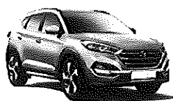
HYUNDAI TUCSON BLUE DRIVE KLASS 4x2 7S CRDI 1.7 115CV 395 euros al mes IVA incluido

Además de ofrecerte una excelente financiación para que puedas adquirir tu automóvil, trimestralmente te presentamos una selección de vehículos, diseñada para los que formáis parte del Programa, con un sistema que te sorprenderá en cuanto lo conozcas: Bansacar, el renting del Santander.