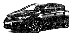
TOYOTA AURIS (Pack Senso) 1.4 90D ACTIVE 356,26€ al mes. IVA incluido. 1.8 140H HYBRID ACTIVE 387,45€ al mes. IVA incluido.