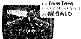
TomTom VIA 1025L 5.0 pulgadas de REGALO